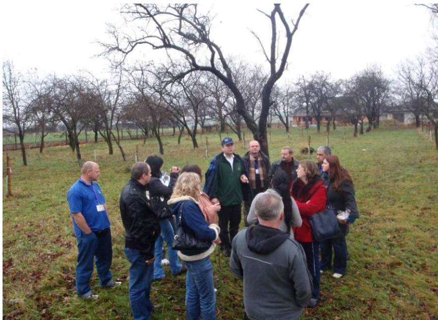
Obr. Prezentace výstupu projektu Obnova Bajarova sadu v Hroznové Lhotě partnerům z MAS Zlínského kraje.