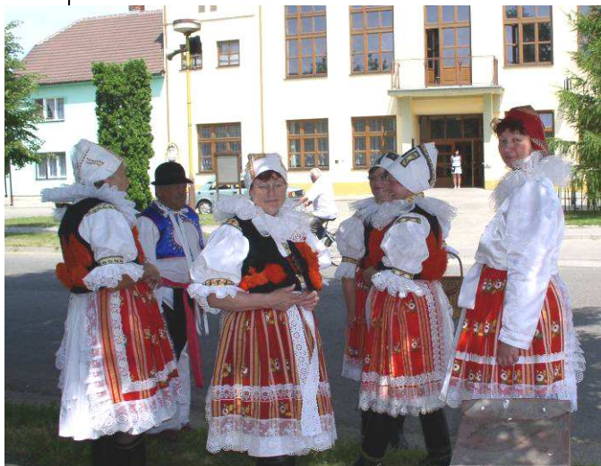
Obr. Kulturní akce na Strážnicku nejsou myslitelné bez krásných krojů.