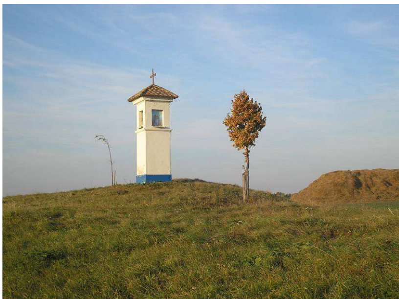
Obr. Realizací projektu 4cykloregio a obnovou drobných památek v krajině byla obnovena nádherná zákoutí.

Zpracovatel: Mgr. Vít Hrdoušek a externí pracovníci