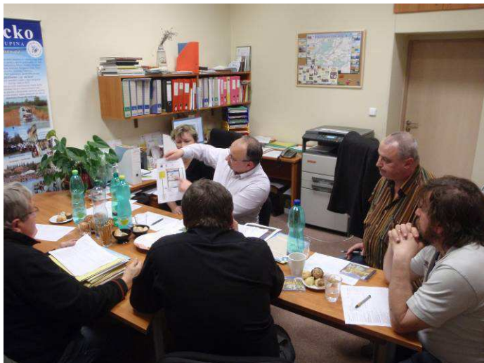
Obr. Jednání pracovní skupiny pro administrativu v kanceláři MAS ve Strážnici