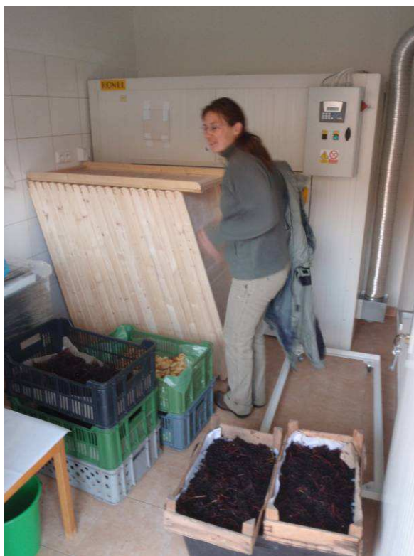
Obr. Komunitní sušárna v akci ve Vnorovech - Liděřovicích užívaná v rámci projektu Podpora ovocnářství ve Vnorovech