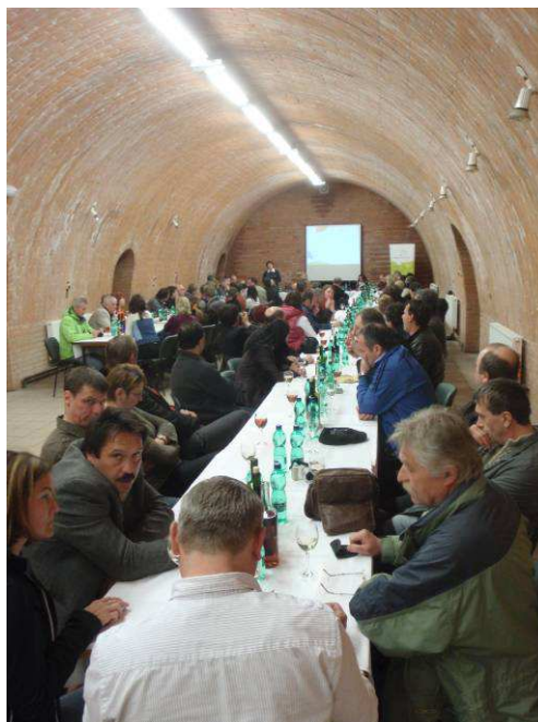
Foto: Seminář a exkurze obcí Zlínského kraje v MAS Strážnicko

V roce 2011 se naše MAS, jako člen Národní sítě MAS , účastnila setkání tohoto sdružení na celostátní konferenci Venkov, mezinárodní akci Leaderfest, či na konferenci Modlitba pro venkov. Strážnicko MAS jako člen NS MAS ČR a KS NS MAS JMK spolupracuje s řadou dalších subjektů a účastní se řady setkání a akcí k rozvoji venkova ve spolupráci se Spolkem obnovy venkova, Jihomoravským krajem, centrálou cestovního ruchu, MZE, MŽP apod. Naše MAS také připravila řadu exkursí a návštěv po realizovaných projektech pro další MAS z ČR a ze zahraničí.