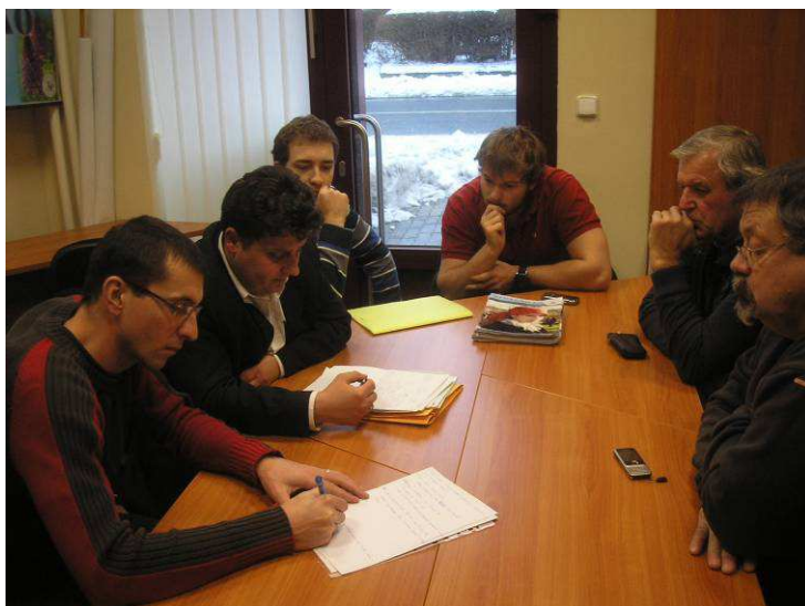
Obr: Z přípravy přeshraničního projektu tvorby biocenter a seminář o řemeslech

Další projekt přeshraniční spolupráce s názvem Obnova biocenter na C-S příhraničí , kde jsou mj. partnery Město Skalica, Občianske združenie Remeselný dvor Skalica a obec Sudoměřice. MAS Strážnicko pomohlo s přípravou dokumentace a koordinuje projekt jak v přípravě, tak i v realizaci v návaznosti na projekt Venkovské Tradice v krajině. V rámci MAS také vzniklo otevřené sdružení výrobců, které získalo mezinárodní certifikaci Convivium Slow food .