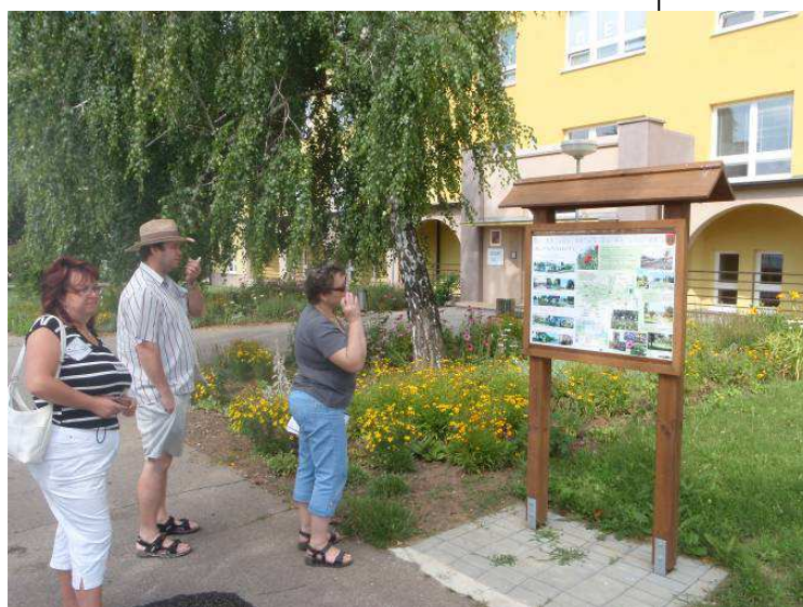
Obr. Kontrola realizace projektu – Úprava veřejného prostranství před ZŠ Hroznová Lhota