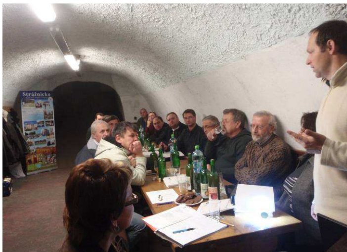
Obr. Seminář k evaluaci SPL MAS Strážnicko v Petrově-Plížích, 23.11.2011.

Funkce programového výboru vykonává rada, funkce monitorovacího výboru kontrolní výbor