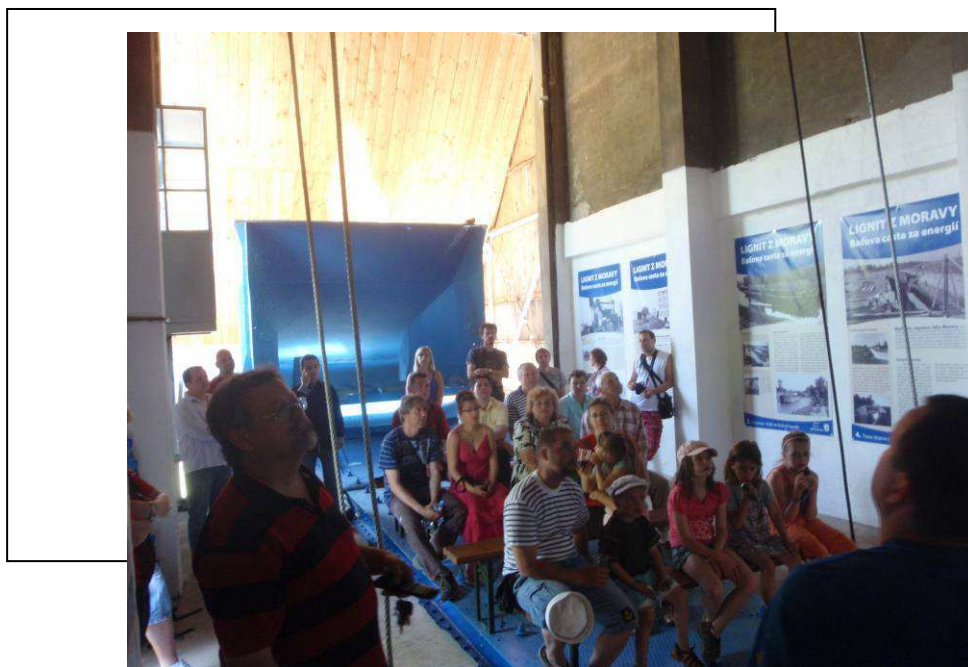
Obr.: Otevírání expozice Výklopník na Baťově kanálu v květnu 2011.

K výše uvedeným tématům vznikly www.stránky s databází. V polovině roku byl projekt ukončen a závěrem roku 2011 byl předán k proplacení a následně proplacen. Na tento projekt se připravuje také následný projekt spolupráce.