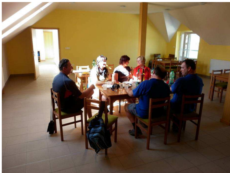
Obr. Závěrečné jednání z exkurse po projektech realizace Leader v nové klubovně TJ Sokol Kněždub.