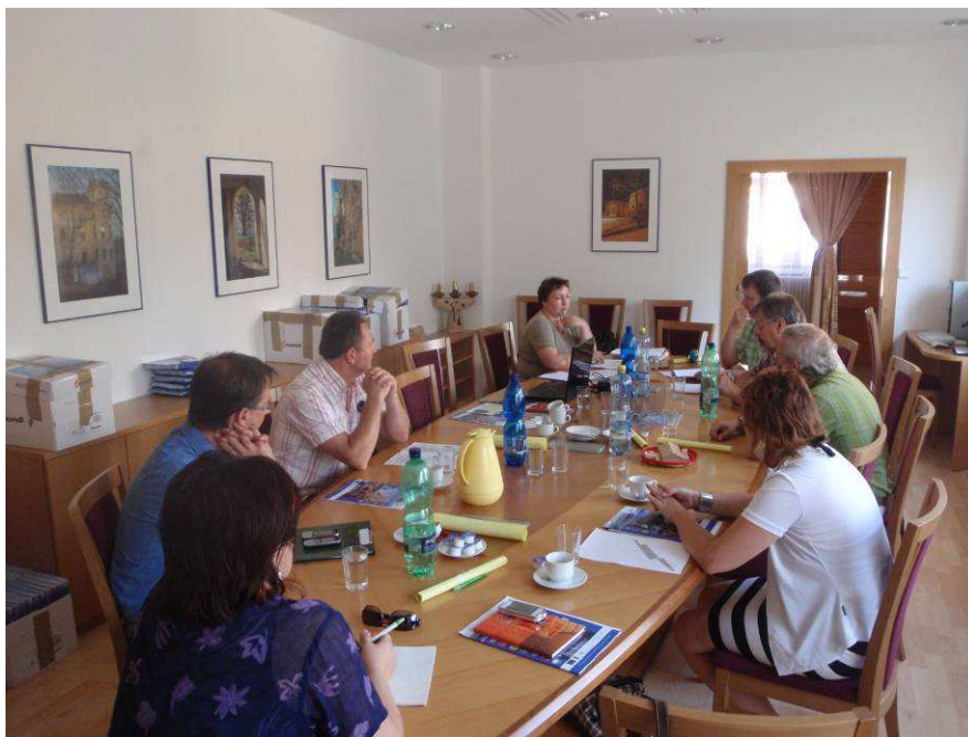
Obr: Jednání Mikroregionu Strážnicko, kde je diskutována jednotná strategie a propagace Strážnicka za podpory MAS Strážnicko.

podepisují Dohodu se SZIF o dotaci na projekt (50-90%), kterou však získají do 12 týdnů po vlastním profinancování celé akce (tj. 100% nákladů projektu) . Proto je také důležité zajistit schopnost vlastního předfinancování každého projektu (úspory, půjčka, úvěr...) a zajistit proplacení realizace řádně vybrané dodavatelské firmě přes vlastní účet.