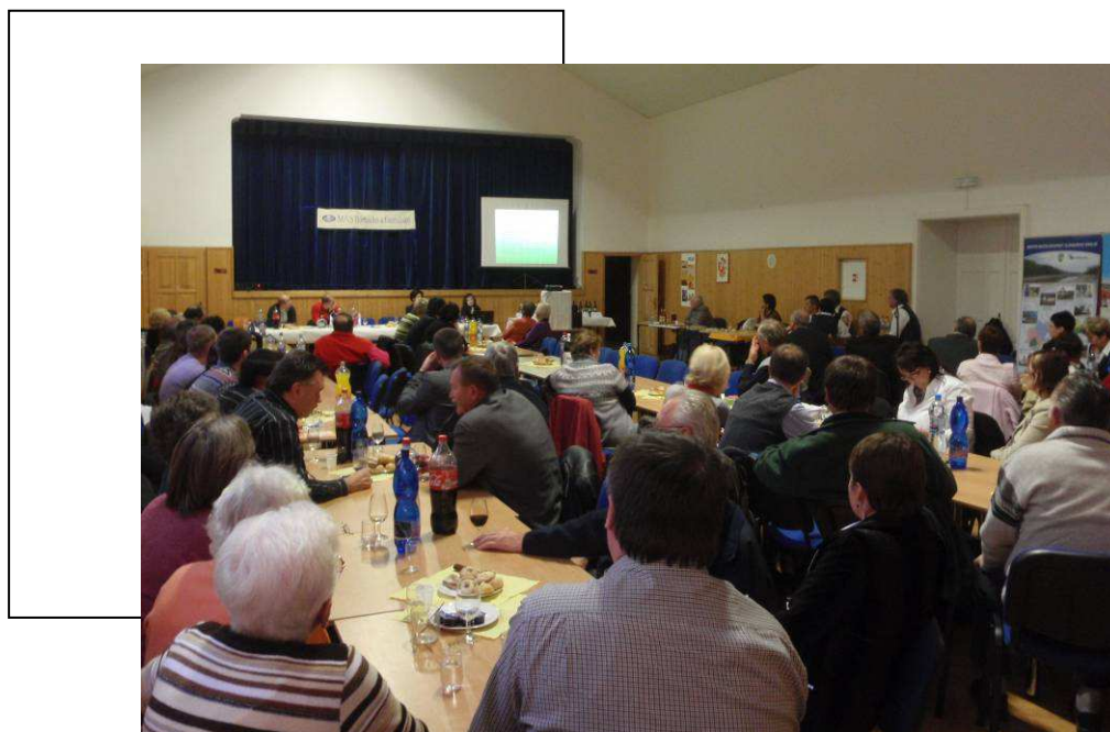
Obr: Setkání zástupců obcí, spolků a podnikatelů v rámci projektu v listopadu 2011

Projekt se naplno začal rozbíhat koncem léta, kdy probíhal průzkum, a vytvářela se dokumentace o starých ovocných dřevinách v jednotlivých regionech. Partneři projektu se vzájemně představili na společném setkání MAS v listopadu 2011 v Ostrožské Nové Vsi . Následně proběhla prohlídka památkového domku v Ostrožské Nové Vsi, který bude v rámci projektu kompletně rekonstruován pro zázemí spolků. V MAS Strážnicko bude obnovena Hotařská buda pod vrchem Žerotín ve Strážnici.